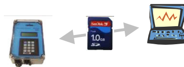
pH 濁度計 テキスト読み画面